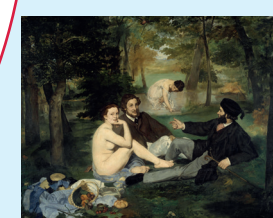
• Édouard Manet (1832-1883) > Le Déjeuner sur l'herbe (1863)