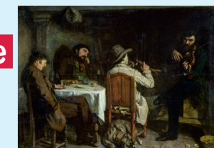
• Gustave Courbet (1819-1877) > L'Après-dînée à Ornans (1848-1849)