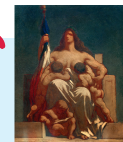
• Honoré Daumier (1808-1879) > La République (1848)