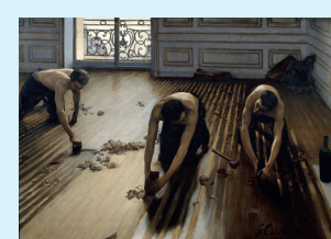
• Gustave Caillebotte (1848-1894) > Les Raboteurs de parquet (1875)