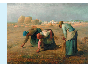
• Jean-François Millet (1814-1875) > Les Glaneuses (1857)